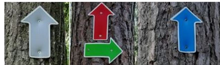
Taku marķējuma zīmes

Atkritumu regulāru savākšanu pie piemiņas vietas (0,1 ha) un piemiņas vietas uzturēšanu, par šiem darbiem noslēdzot sadarbības līgumu ar LVM.